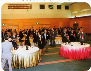
(セラム・ジャパン'96)