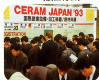
CERAM JAPAN '93