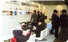
(セラム・ジャパン'93)