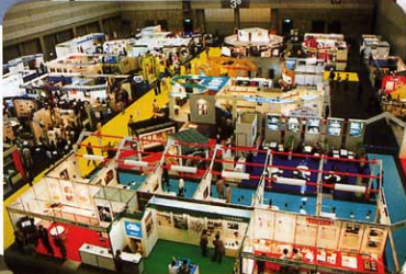
(セラム・ジャパン'96)