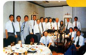
(柳田先生を囲む会)