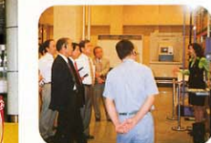
(工場見学・ダイワク)