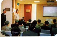
(工場見学・ダイワク)