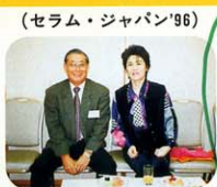
(セラム・ジャパン'96)