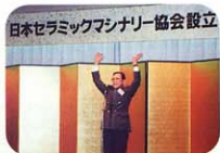
日本セラミックパートナー協会設立