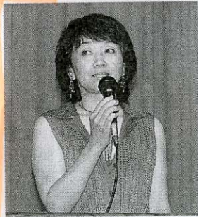
同部会主催の中国の古典に学ぶ講演会は昨年12月に続いて2度目で、会員約120人が参加した。

易経を、現代の企業経営に生かす方法を紹介。易経の龍の話を交えながら「企業経営や要」などを説いた。